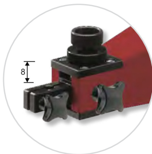
Parallel-Feineinstellung, Verstellweg ca. 8mm Parallel fine adjustment, adjusting range approx. 8mm