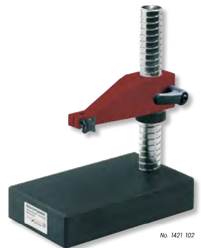
No. 1421 102